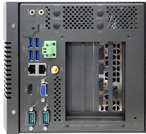
Вид сзади (видеокарта – опция)